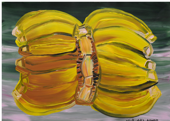
近藤亜樹, インドの実 2018, acrylic on paper, 27x38cm