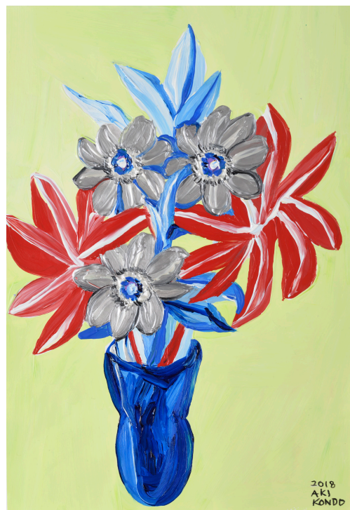
近藤亜樹, 飾る, 2018, acrylic on paper, 38x27cm

近藤亜樹は 1987 年北海道生まれ。札幌在住。2012 年東北芸術工科大学大学院実験芸術学科修了。