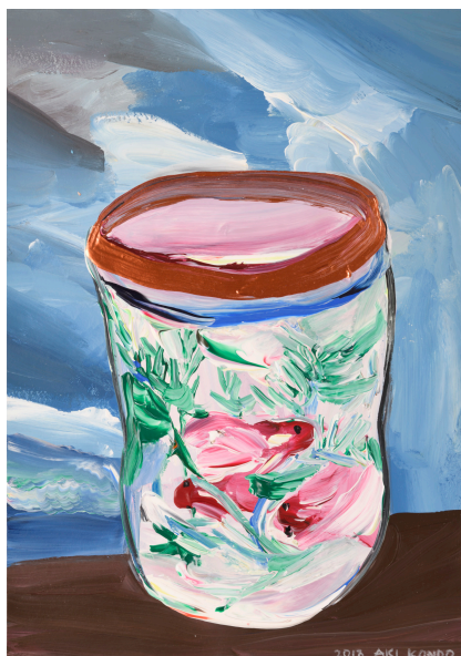
近藤亜樹, 瀬戸の海 2018, acrylic on paper, 38x27cm