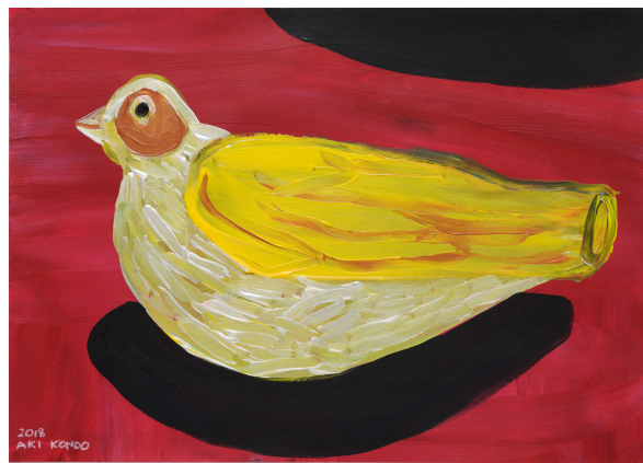
近藤亜樹, あなたを呼ぶ笛 2018, acrylic on paper, 27x38cm