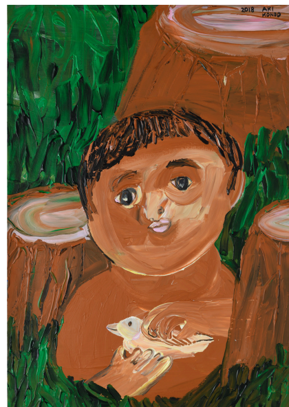
近藤亜樹, 森の子 2018, acrylic on paper, 54x38cm