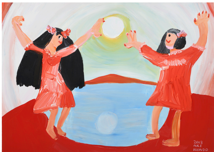
近藤亜樹, 双子の約束, 2018, acrylic on paper, 27x38cm