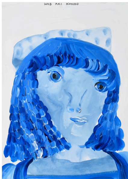
近藤亜樹, 記憶の湖 2018, acrylic on paper, 38x27cm