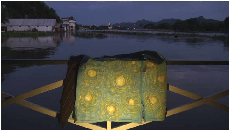
山本篤, Sunny days in Thailand , 2013, HD ビデオ, 13 分 50 秒

台北を拠点にアジア、アメリカ、ヨーロッパの各地で滞在制作を行い、美術館、ギャラリー、アートのスペースでの発表が続く。主な展覧会：「The Enormous Space」OCAT Shenzhen（深圳、2018）、「Not untitled」シュウゴアーツ（2017）、「A small sound in your head」S.M.A.K（ゲント、2016）、「Hold your breath, dance slowly」ウォーカーアートセンター（ミネアポリス、2016）、「The voice behind me」資生堂ギャラリー（2015）。ヴェネチアビエンナーレ香港代表（2013）