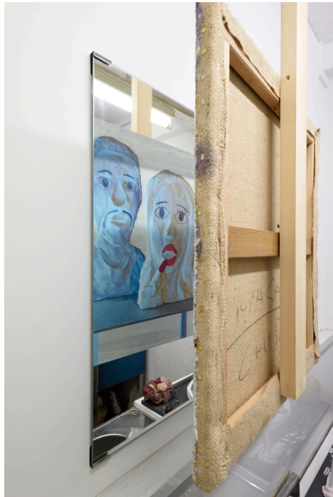
千葉正也, 私たちの神たちの神たちはあなたたち, 2018 キャンバスに油彩, 鏡, 木材, キャンバス: 53×45.4cm, 鏡: 60×50cm (参考画像)

*installation view at The Steak House DOSKOI, 2018