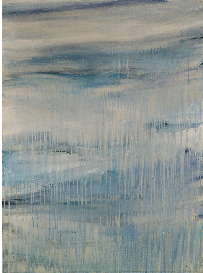
丸山直文, sky (kitami) B , 1988, acrylic on cotton, 130.5x97.5cm

シュウゴアーツは、丸山直文の初期の作品による展覧会「シュウゴアーツショー: 丸山直文 はじまり」を開催します。