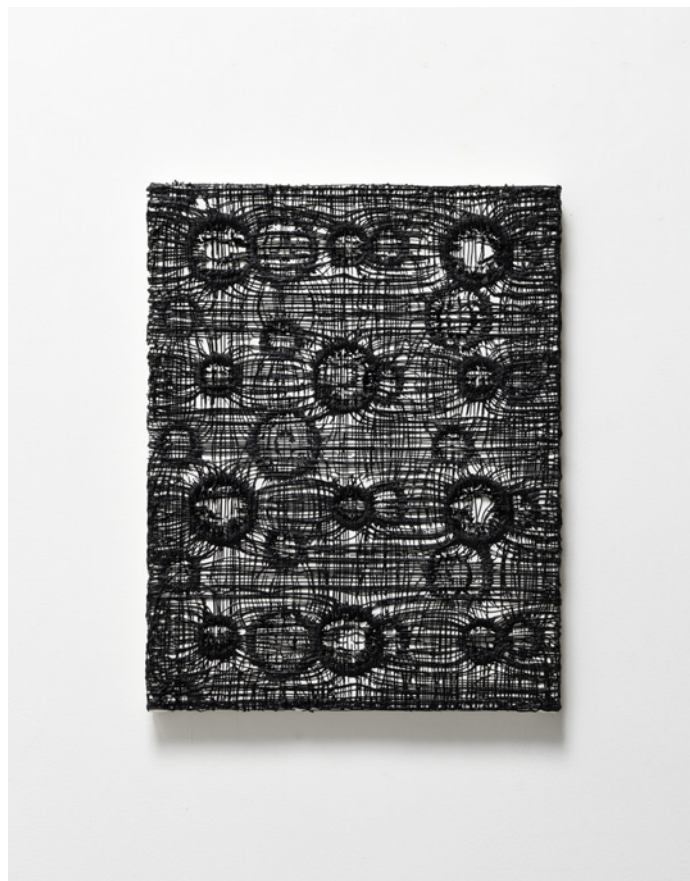
高島依子, MARS , 2020 acrylic, pigment, iron sand on canvas, 41x32cm