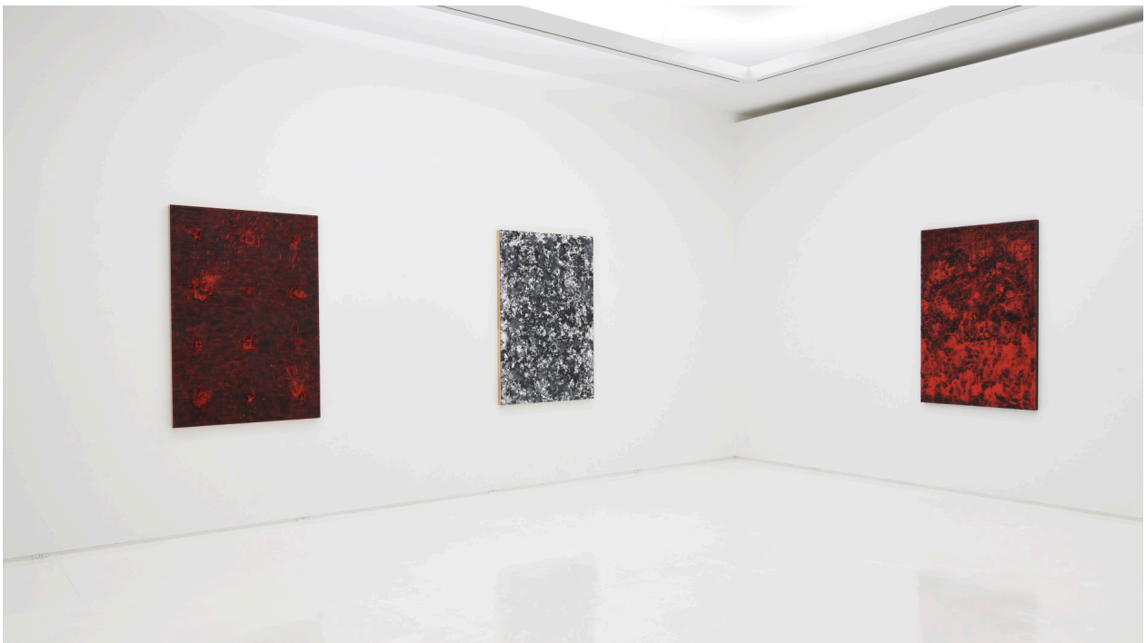
左から) 高畠依子《ヴィーナス, 噴火 PR3》2019; 《ヴィーナス, 熱圧 PBk6 PW6 PM1》2019; 《ヴィーナス, 燃 PR3》2019 シュウゴアーツショー展示風景, 2019

用を用いて制作されたシリーズを披露しました。いずれも観察を通して絵具の未知なる特性を追求する行為が制作の基盤に据えられています。その一方で理系的アプローチだけを拠り所とするのではなく、水を創造の源泉、熱を生命の誕生と捉えるなど芸術家としての豊かな感性が、制作技術や科学的事物の単なる援用に陥らない深みを作品に与えています。しかしながら感覚的な表現は高畠にとっては主眼ではなく、裏付けと具体的な手法を用いて新たな視覚芸術の提示を果敢に試みる真摯な姿勢には、イタリアルネサンスから印象派、抽象表現主義に及ぶ自然科学と人文科学の調和を目指した芸術家たちの系譜を思い起こさせるものがあります。