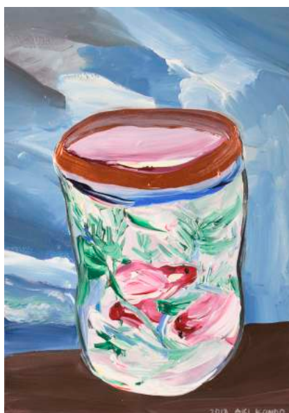
近藤亜樹, 瀬戸の海 2018, acrylic on paper, 38x27cm