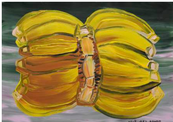
近藤亜樹, インドの実 2018, acrylic on paper, 27x38cm