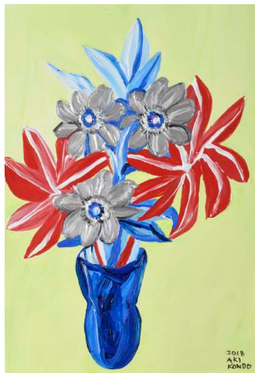
近藤亜樹, 飾る, 2018, acrylic on paper, 38x27cm

近藤亜樹は 1987 年北海道生まれ。札幌在住。2012 年東北芸術工科大学大学院実験芸術学科修了。