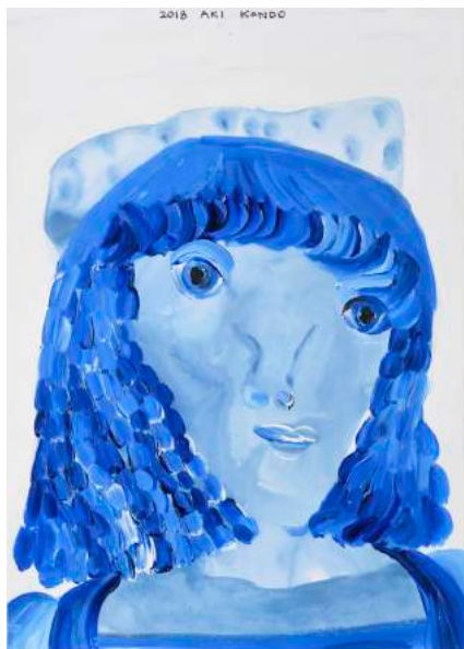
近藤亜樹, 記憶の湖 2018, acrylic on paper, 38x27cm