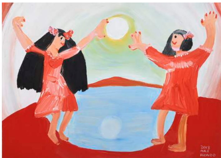
近藤亜樹, 双子の約束, 2018, acrylic on paper, 27x38cm