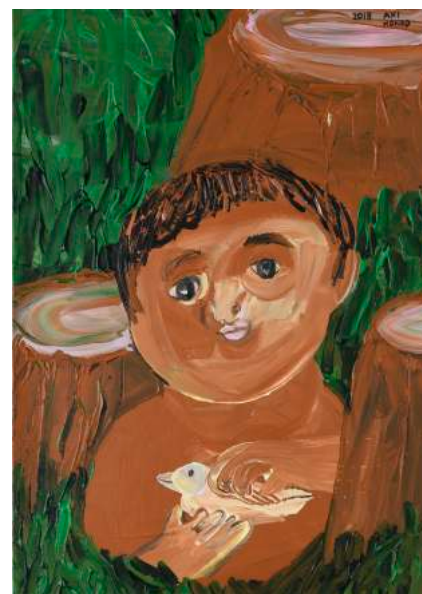
近藤亜樹, 森の子 2018, acrylic on paper, 38x27cm