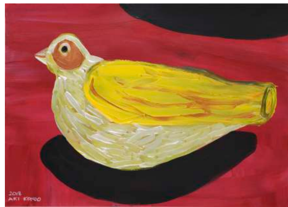
近藤亜樹, あなたを呼ぶ笛 2018, acrylic on paper, 27x38cm